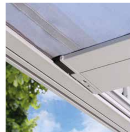
Die ZIP-Technik sorgt für ein Höchstmaß an Stabilität und Langlebigkeit