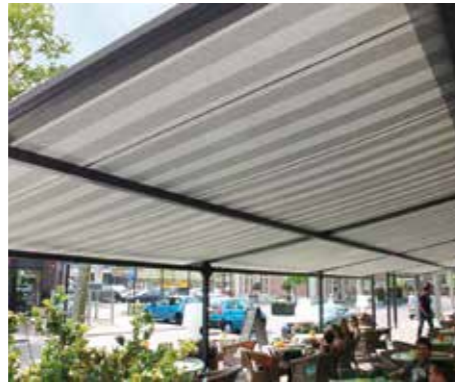
Mittige Leitrohre sorgen ab 350 cm Ausfall für geringeren Tuchdurchhang

Wie beim Q.bus® SZ kann die Novatop Pergola XL-SZ mit seitensaumgeführten Behängen ausgestattet werden.