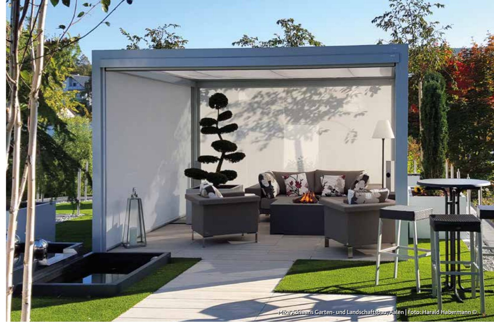
Mike Adriaens Garten- und Landschaftsbau, Aalen | Foto: Harald Habermann ©

Während im Dachbereich üblicherweise Acryltücher aus einer entsprechenden umfangreichen Stoffkollektion verwendet werden, bietet sich für die Seitenmarkisen der Einsatz von Twilight Pearl-Gewebe an, da dieses aufgrund der leichten Transparenz auch im ausgefahrenen Zustand noch eine gewisse Durchsicht ermöglicht und damit den Charakter des „textilen Wintergartens“ ideal untermauert.