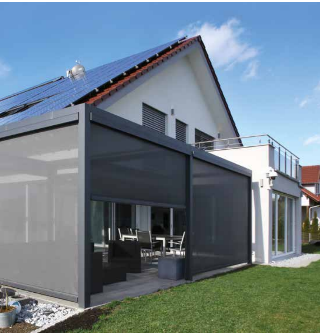
Wohlfühloase: Die Senkrechtmarkise Solaroll SZ mit transparentem Gewebe macht den Q.bus® zum textilem Wintergarten