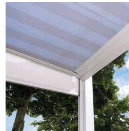
In die Seiten- und Frontbereiche lassen sich zusätzliche Senkrechtanlagen integrieren